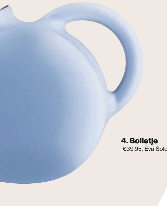
4. Bolletje €39,95, Eva Solo