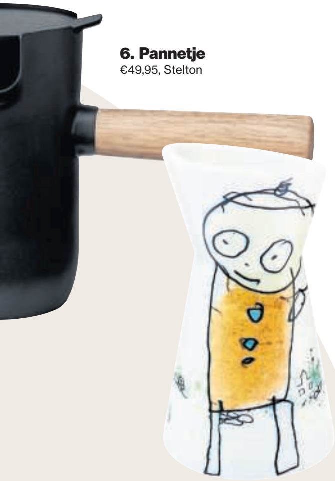
6. Pannetje €49,95, Stelton