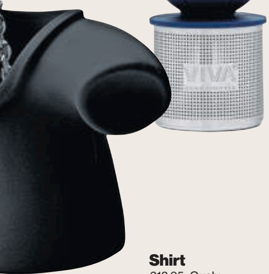
Shirt €12,95, Qualy