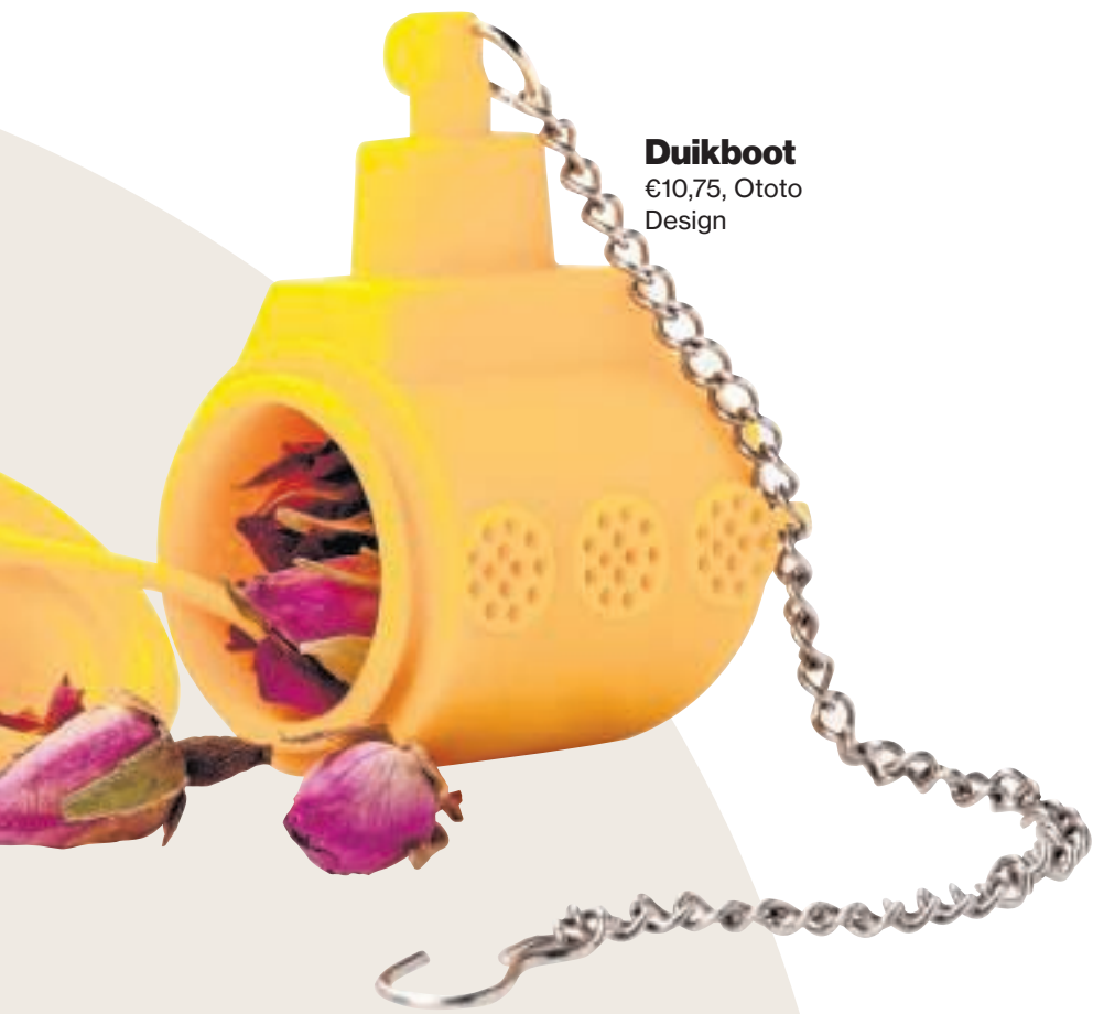
Duikboot €10,75, Ototo Design