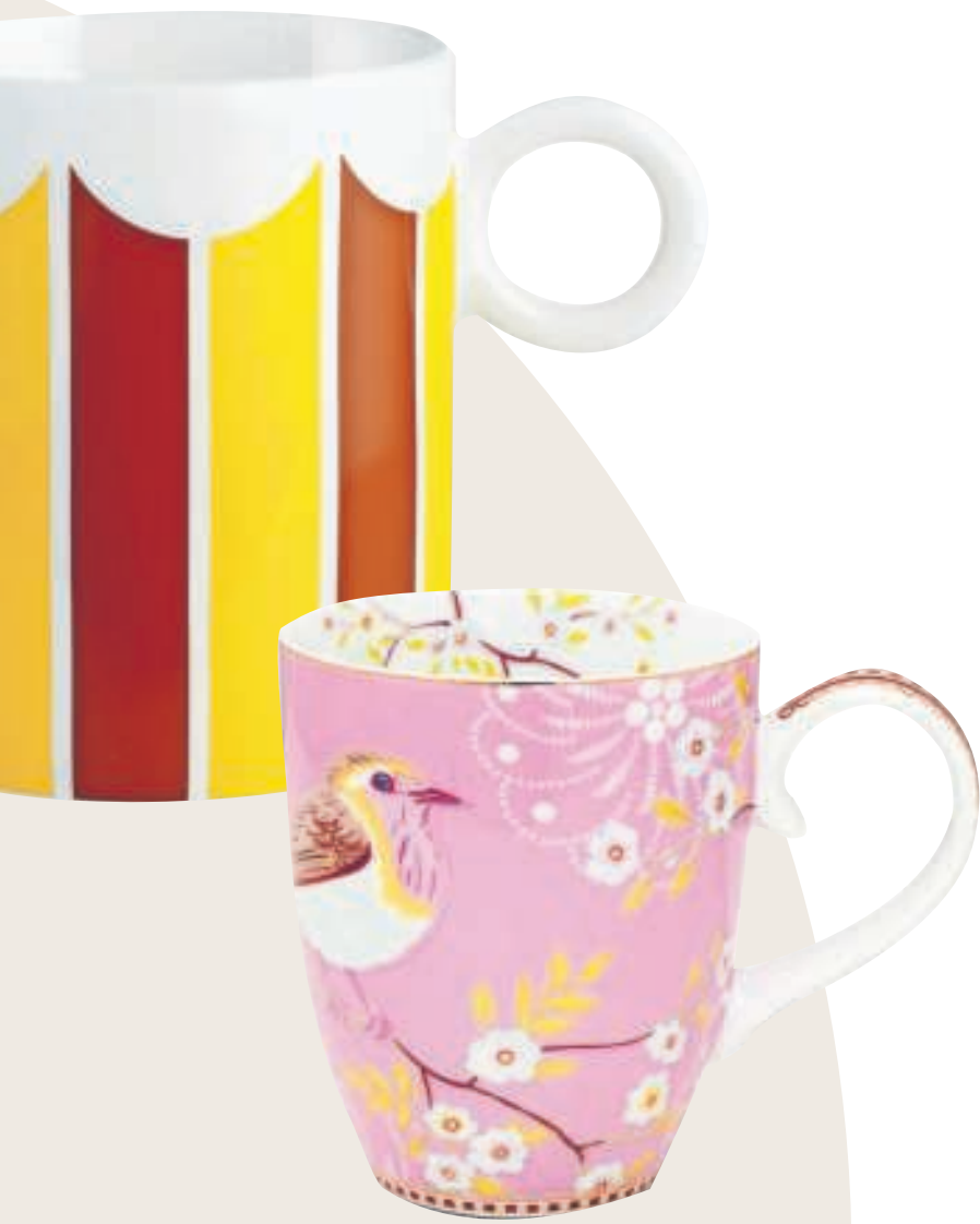
5. Vogeltje €8,95, Pip Studio