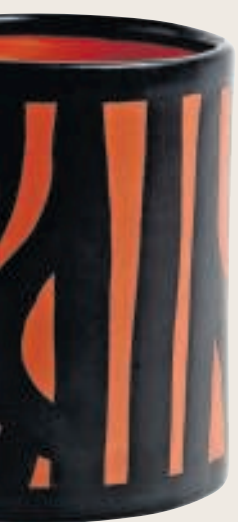
6. Boomstam €15, Hay