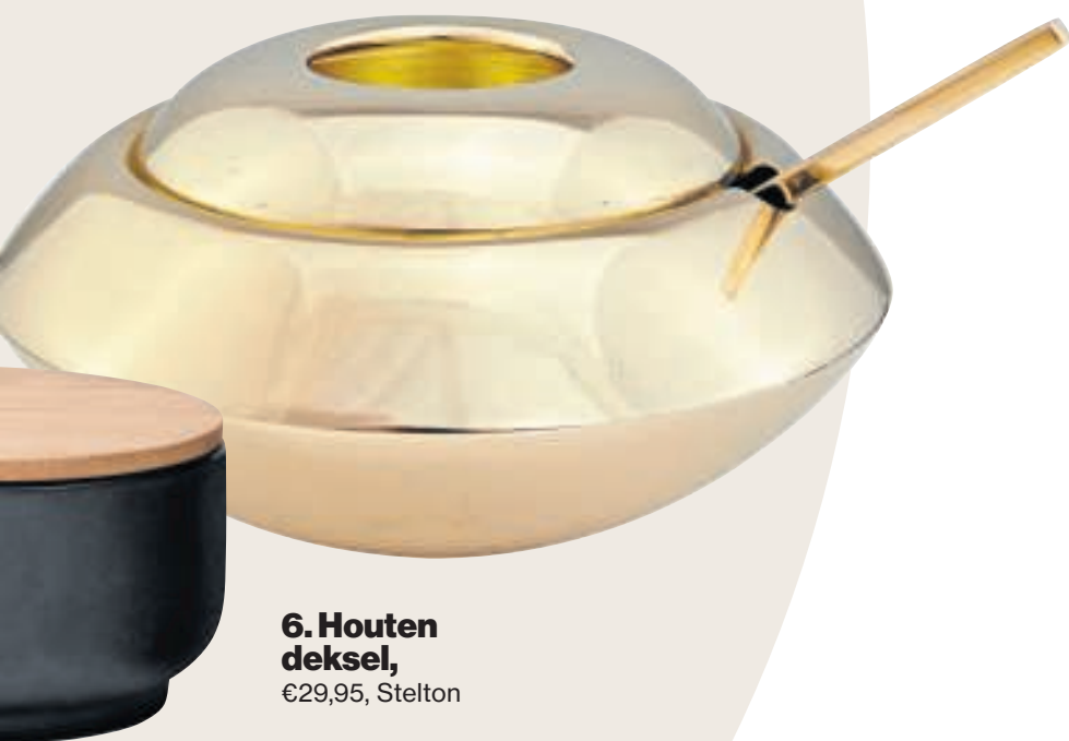
5. Messing, €85, Tom Dixon