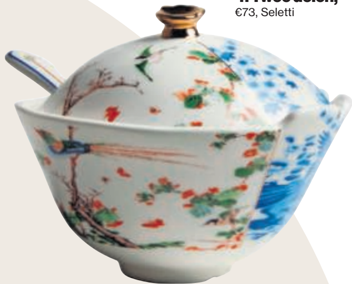
4. Twee delen, €73, Seletti