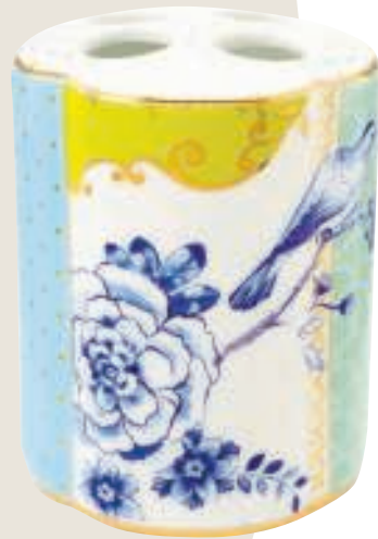
5. Bloem €14,95, Pip Studio