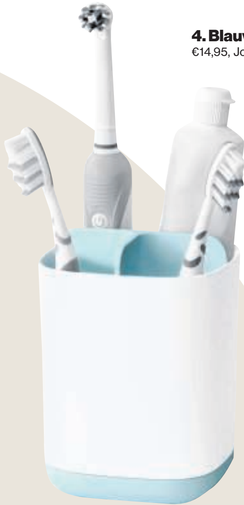
4. Blauw randje €14,95, Joseph Joseph