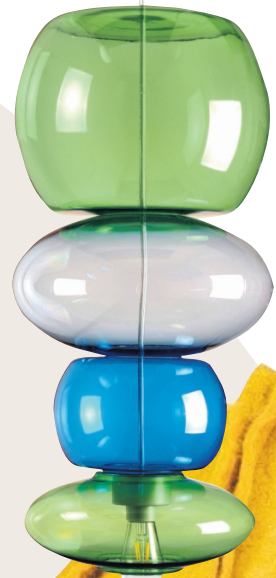
5. Kralen vanaf €149,95, Fatboy