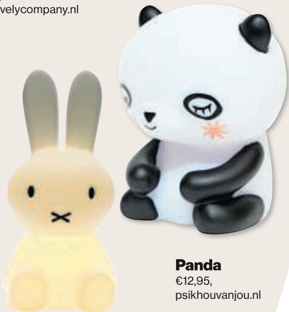
Panda €12,95, psikhouvanjou.nl