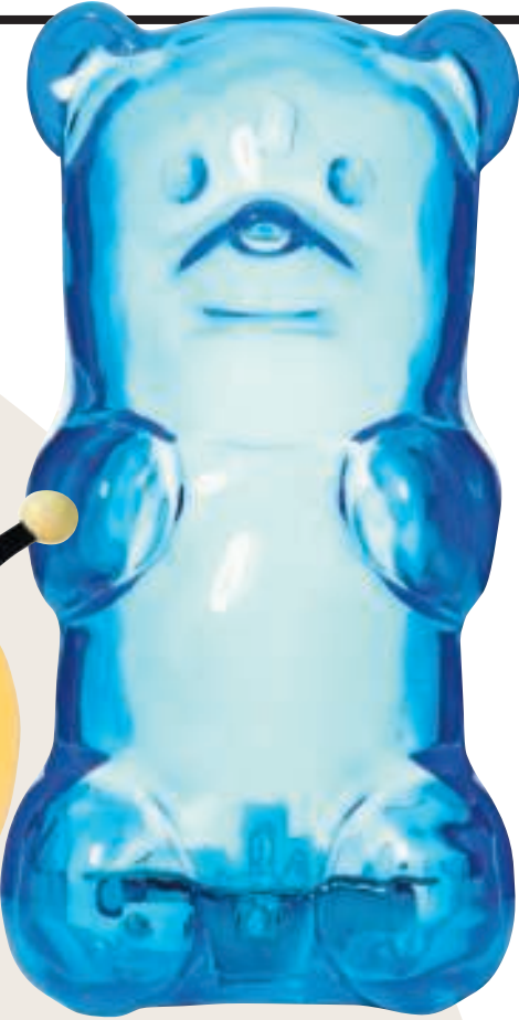
Beer €30, fctry