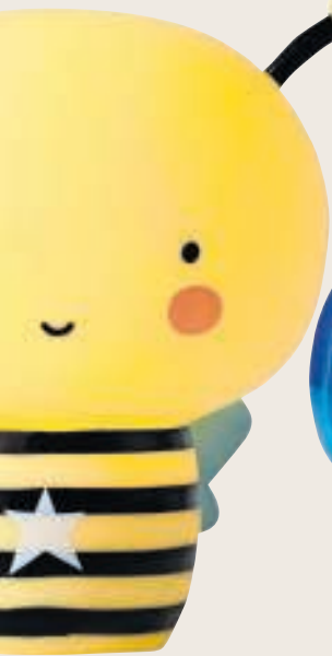
Bij(na donker) €26,95, alittlelovelycompany.nl