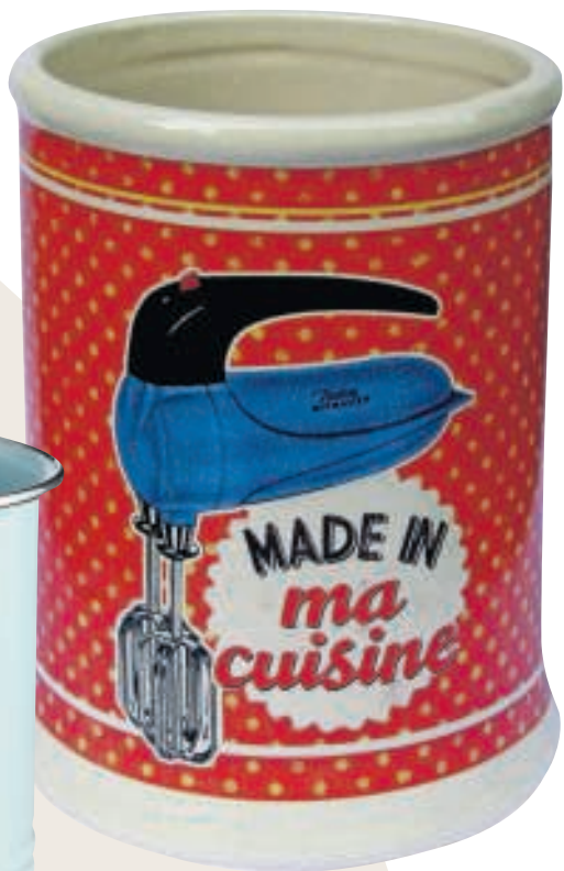
Stippen €11,50, loulechien.com