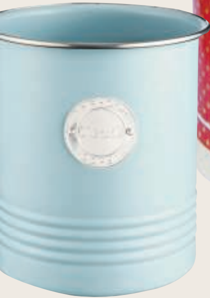
Zachtblauw €17,50, Typhoon