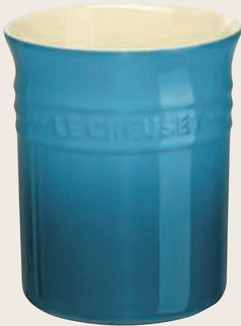
Blauw €27, Le Creuset