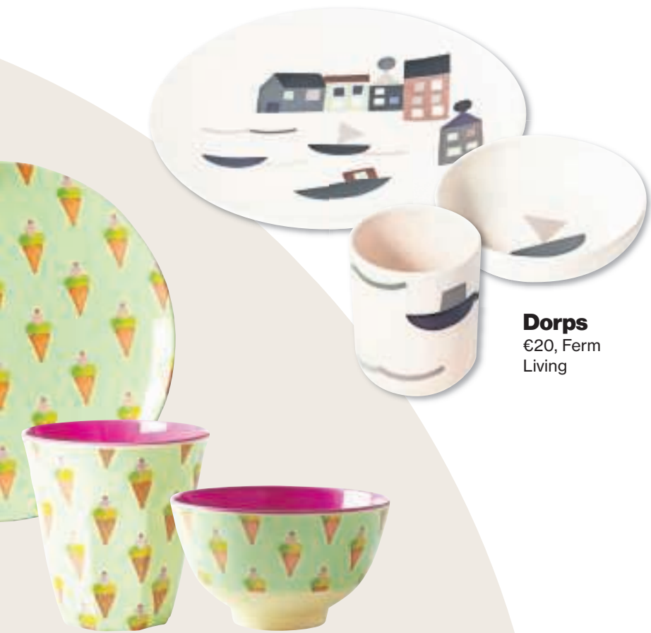
Dorps €20, Ferm Living