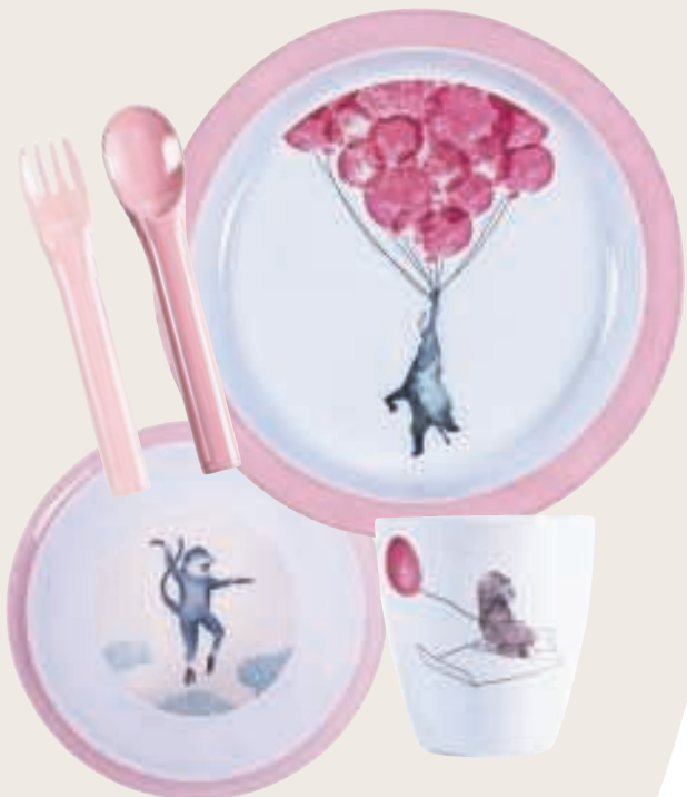
Aap €29,95, Sebra