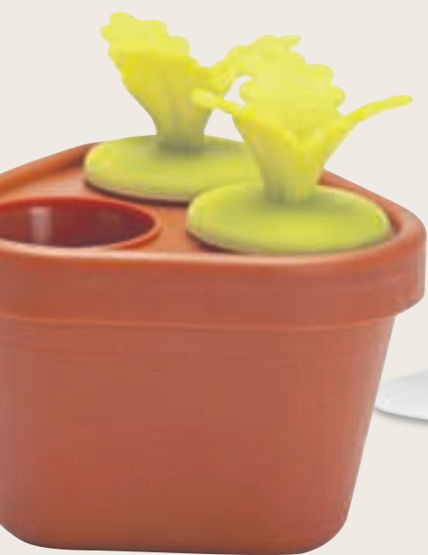
Wortels €13,95, Peleg Design