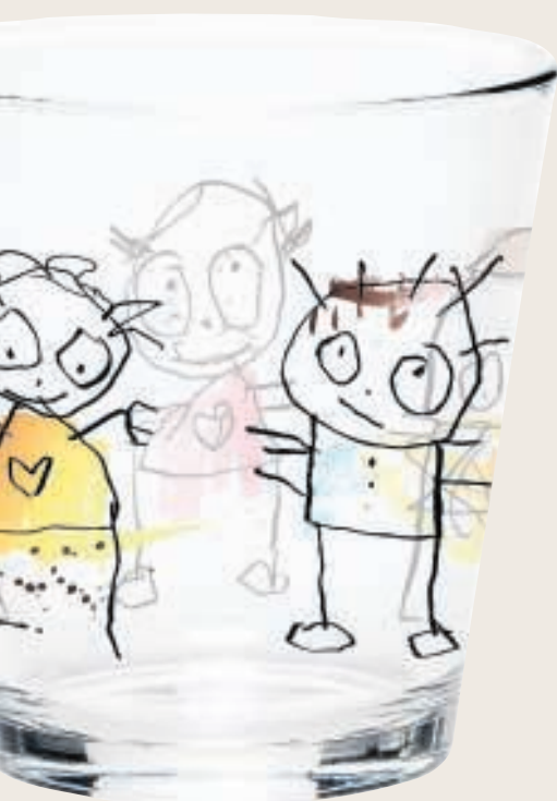
4. Poppetjes €20 per 4, Poul Pava