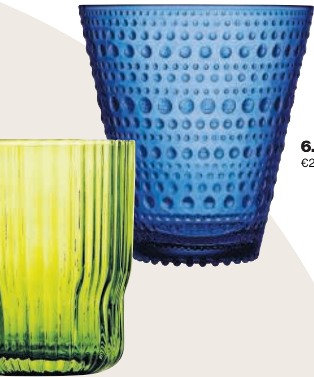
6. Waterdruppels €23,90 per 2, Iittala