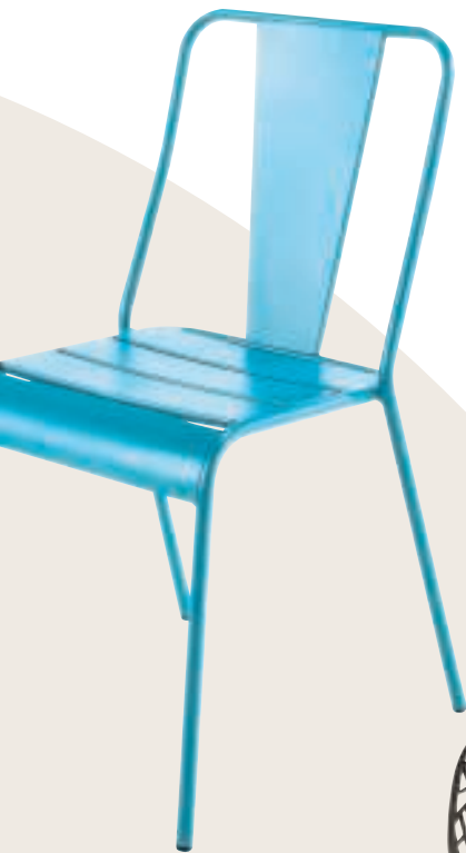
Takkenstoel €402, Fast