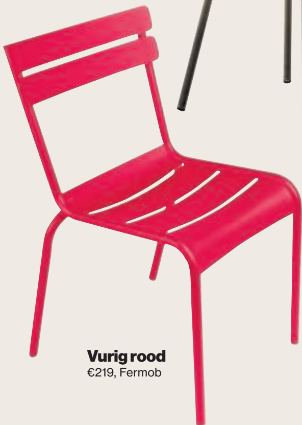
Vurig rood €219, Fermob