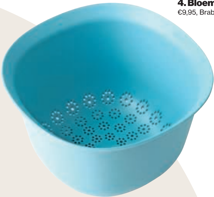
4. Bloemetjes €9,95, Brabantia