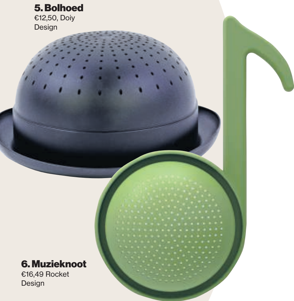
5. Bolhoed €12,50, Doiy Design