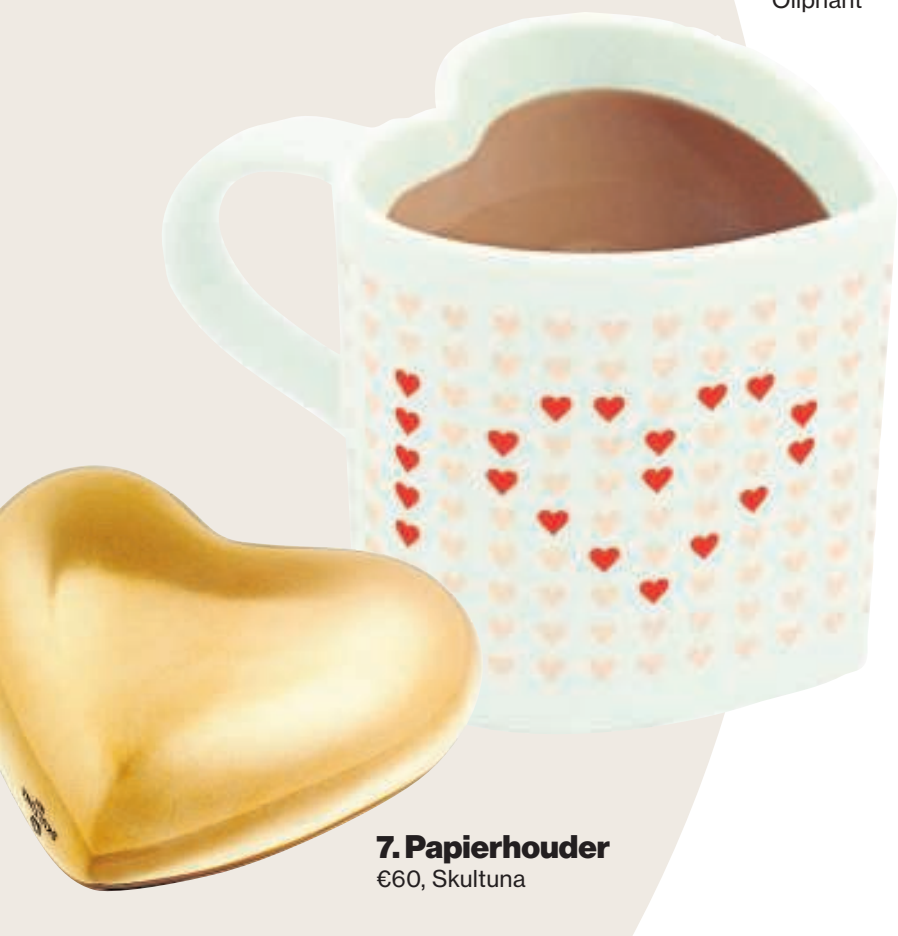
6. Mok €14,95, Oliphant