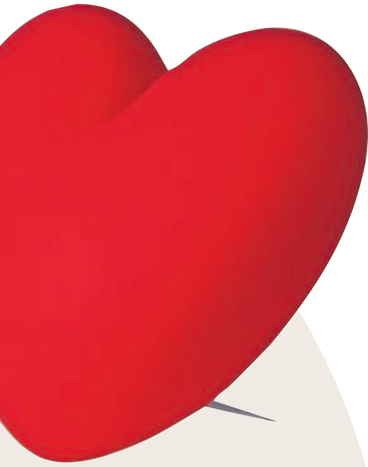
5. Lamp €109,80, Slide Design