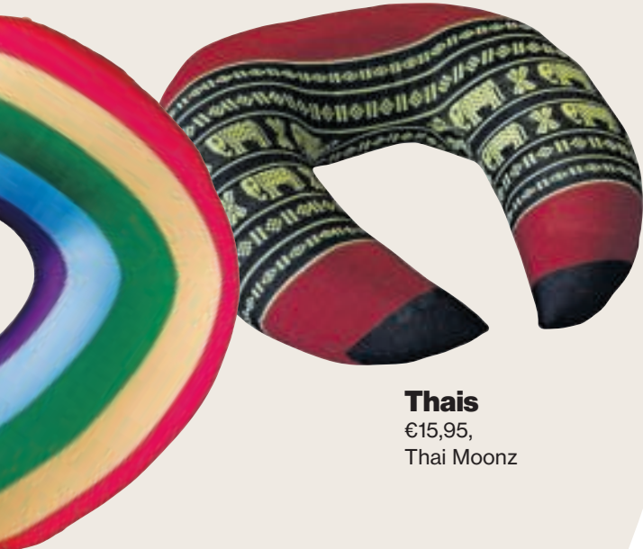
Thais €15,95, Thai Moonz